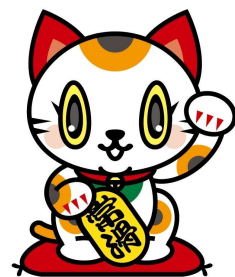
常滑市キャラクター 「トコタン」

※講師陣は弁護士・地域包括支援センター職員など各分野の専門職をそろえております。 ご来校の際は、咳エチケット、手指の消毒等、感染予防にご協力をお願い致します。 体調不良や発熱等症状のある方は、来校をお控えください。